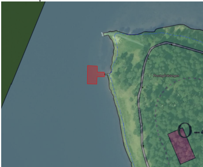
Figur 2 Kartskisse som viser anbefalt område for badstu(er) i utkast til arealplan

Kommunedirektøren anbefaler at følgende område avsettes til arealformål Andre typer nærmere angitt bebyggelse og anlegg (begrenset til brygge og badstu) i utkast til kommuneplanens arealdel: