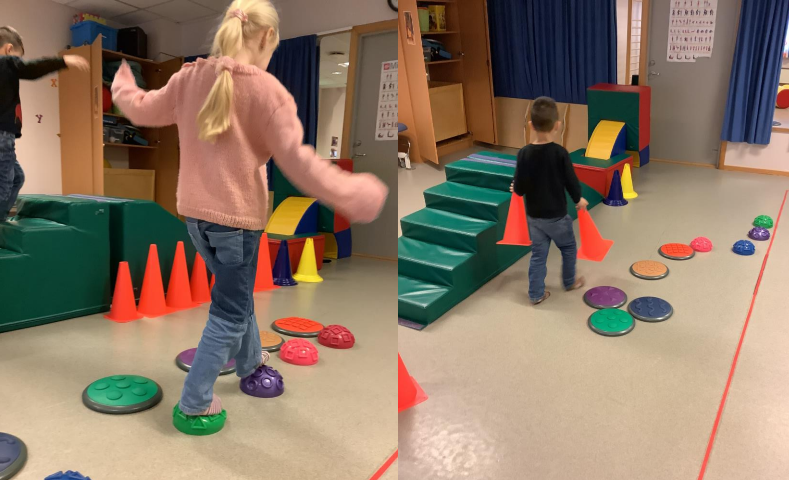
En økt i gymsalen

Jakker og vester blir hengt opp på knaggene i gangen. Skoene blir plassert inntil veggen og barna står nå klare utenfor den store grønne døren. Vi drar dørhåndtaket ned og beveger oss bortover til en stor sal. En sal fylt med mange lekeelementer. Puffer i alle slags farger, kjegler og baller. Vi er framme. Vi har ankommet gymsalen i Thranes gate.