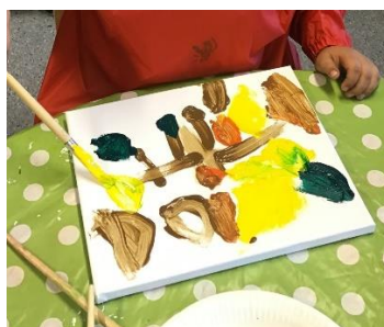
Barna maler høstbilde

Siden barnehageoppstart i august har det vært en fin høst med mye fint vær, og vi har vært mye ute. De siste dagene har det regnet og blåst mye ute. Barna har sett at bladene på trærne har skiftet farge og begynt å falle ned fra trærne - det er det spennende å følge med på videre.