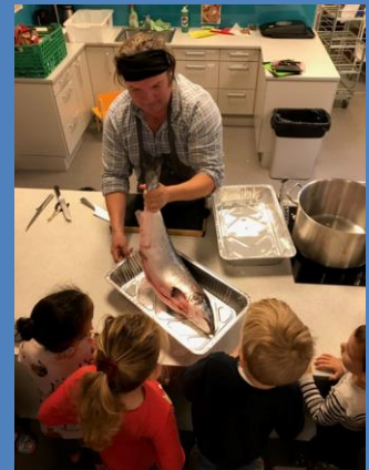
Bård med «sløye-show»

Mål: få mere fisk i barnehagen og mer kunnskap om fisken.