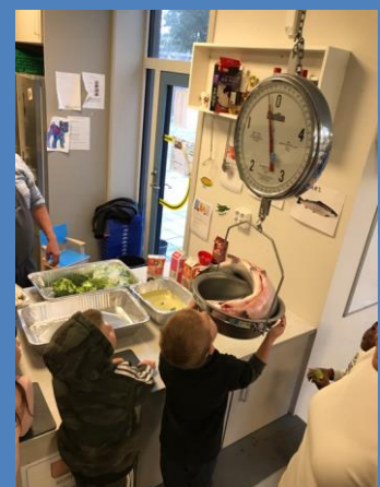
Laksen veide litt over 5 kilo!