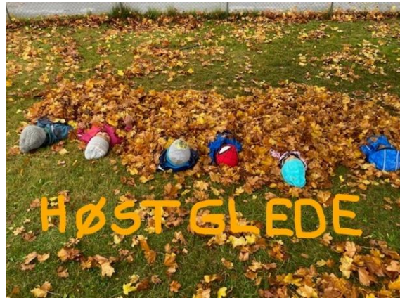
Bilder fra flotte stunder på uteplassen vår